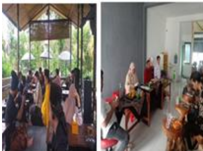
Gambar 2. Pelaksanaan Kegiatan