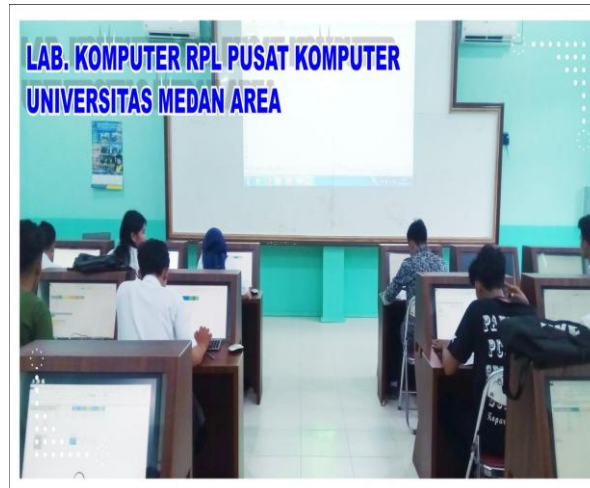
Gambar 2 Suasana Laboratorium Universitas Medan Area

telah mengikuti pelatihan. Hal ini dikarenakan keterbatasan kesesuaian jadwal antara jam mahasiswa dan juga kegiatan pembelajaran di lingkungan kampus. Pemilihan hari pelaksanaan pelatihan dilakukan pada hari senin 09 September 2019 di Laboratorium Universitas Medan Area yang dimulai dari jam 15.00 – 17.00 WIB. Pada tanggal 18 November 2019 dilakukan proses pendampingan dan evaluasi terhadap mahasiswa yang telah mengikuti pelatihan ini.