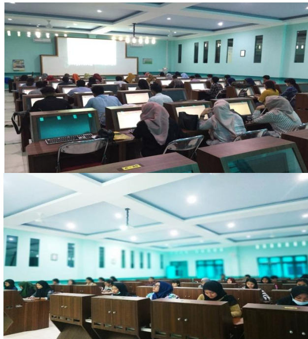
Gambar 3. Suasana saat Pelatihan berlangsung