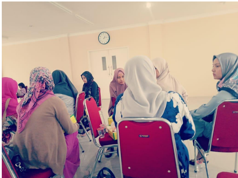
Gambar 2. Kegiatan Pengabdian